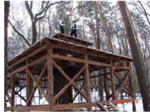
Grundsteinlegung – 07. 12. 2008 Richtfest – 18. 02. 2009