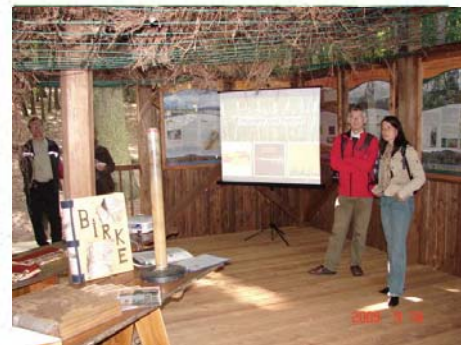
Eröffnung – 18. 09. 2009 Teufelssee - Müggelberge Köpenick